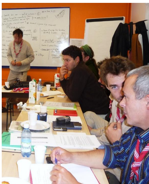
Membres du CA en tour de table de réflexion

L'assemblée générale du 12 octobre 2013 et la réunion du conseil d'administration du 7 décembre dernier ont donné lieu à l'élection du C.A. et du bureau de l'association pour l'année 2013-2014 :